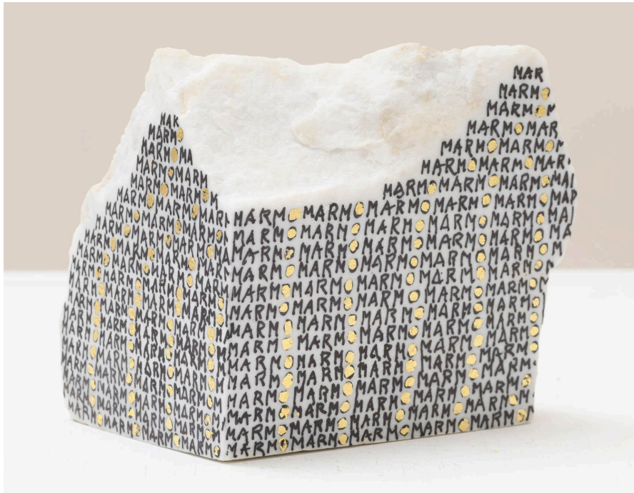
Untitled (serie scritte), 2024

In her marble works, the inscribed text becomes abstract through repetition, allowing the material to transcend its traditional associations. The marble, a durable and precious material, becomes an intimate surface for personal reflection, transformed by Schödl’s feminist reinterpretation into something both fragile and enduring, finding a balance between the permanence of stone and the ephemerality of language.