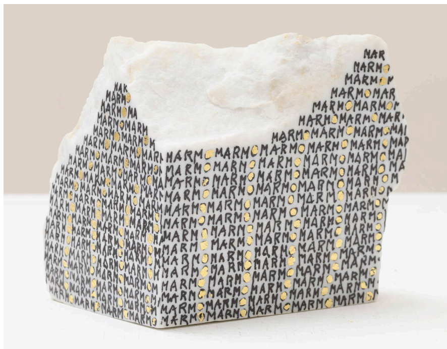
Untitled (serie scritte), 2024

Nelle sue opere in marmo, il testo inscritto diventa astratto attraverso la ripetizione, permettendo al materiale di trascendere le sue associazioni tradizionali. Il marmo, materiale durevole e prezioso, diventa una superficie intima per la riflessione personale, trasformata dalla reinterpretazione femminista di Schödl in qualcosa di fragile e duraturo allo stesso tempo, trovando un equilibrio tra la permanenza della pietra e l'effimero del linguaggio.