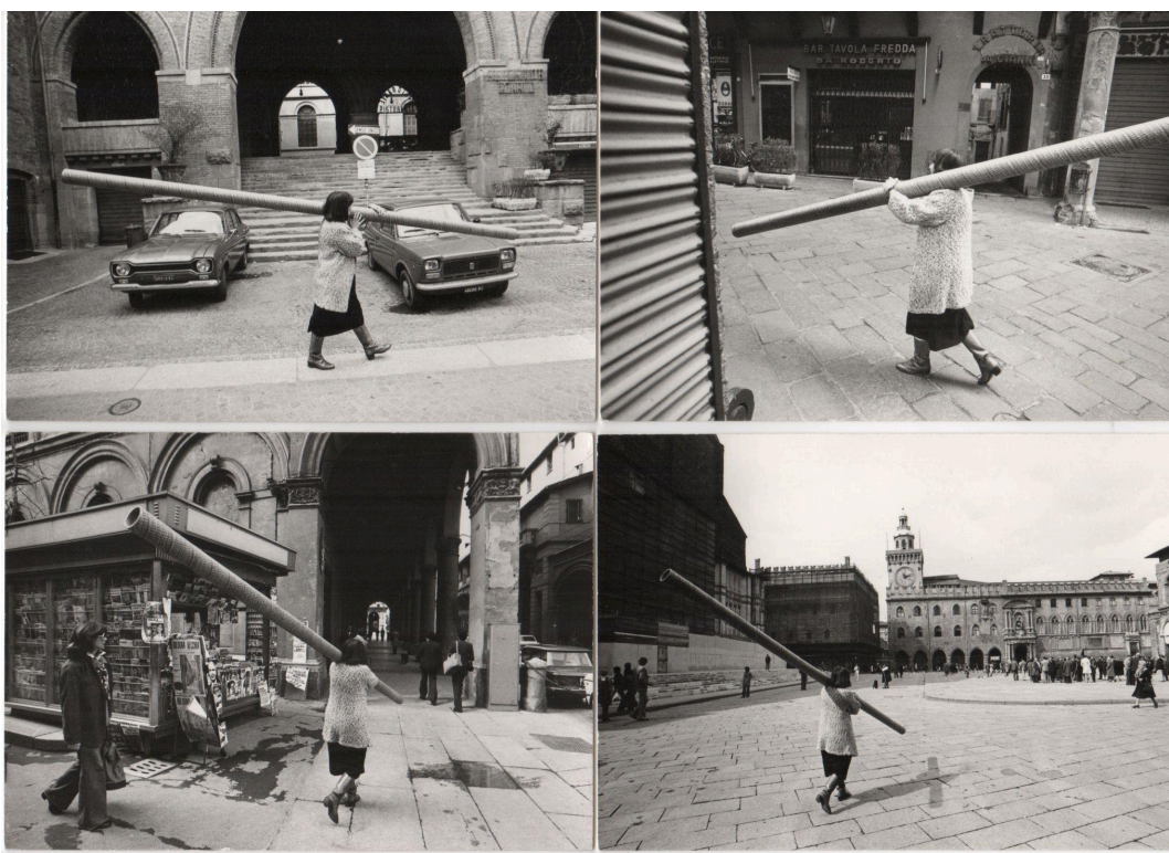
Tube performance, 1978

A questo interesse fa eco un'altra opera chiave, Tube , un tubo di cartone inscritto con un testo in tedesco antico ripetuto e accentuato con foglia oro. Tube esemplifica la pratica performativa dell'artista degli anni Settanta e Ottanta, in cui rifletteva sui simboli e gli stereotipi della cultura italiana, ponendosi come artista donna e "outsider". Le minuziose iscrizioni, combinate con la foglia oro, sfidano la percezione della materialità e riflettono sull'identità, il linguaggio e le narrazioni culturali radicate.